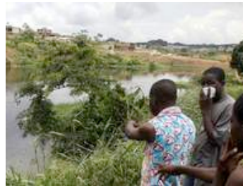
Anwohner eines Sees auf dem Dokoui-Plateau der Elfenbeinküste halten sich wegen des vom Giftmüll ausgehenden Gestanks Taschentücher vor ihre Gesichter.

Noch schlimmer ist die Bleibelastung im peruanischen La Oroya: Angeblich ist sie bis zu 45 Mal höher als normal. Asthma, Bronchialerkrankungen sowie Nieren- und Nervenleiden sind in der Einwohnerschaft weit verbreitet. La Oroya gilt als das Bergbau-Zentrum von Peru. Das Gestein um die Stadt ist durchsetzt mit Blei, Kupfer, Zink und Silber. Die Abwässer der Armen-Hütten sind verseucht, die Abgase mit Blei, Arsen und Cadmium angereichert. Saurer Regen belastet potentielle Anbauflächen genauso wie den Fluss Mantaro, an dem auch die Trinkwasserquellen der Hauptstadt Lima entspringen.