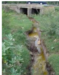
Ranipet, in India: altissimo inquinamento da cromo esavalente

NEW YORK (Stati Uniti) – Esistono posti nel mondo che assomigliano a gironi danteschi, luoghi dove è normale che il 90 per cento dei bimbi soffra di asma infantile e dove l'aspettativa di vita è uguale grosso modo a quella che esisteva nel medioevo. Nella classifica redatta dall'associazione ambientalista americana Blacksmith Institute tra i primi 10 di questi posti tre figurano in Russia, uno in Cina, uno in Repubblica Dominicana, India, Kirgizistan, Perù, Ucraina e Zambia. La triste classifica considera la natura delle sostanze