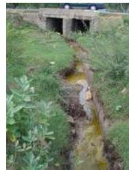
Ranipet, in India: altissimo inquinamento da cromo esavalente (Internet)