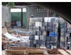
Haina (Repubblica Dominicana). L'ambiente è saturo di piombo

Tre sono in Russia, ma Chernobyl è solo nona. Luoghi in cui l'aspettativa di vita è simile a quella del medioevo in Europa