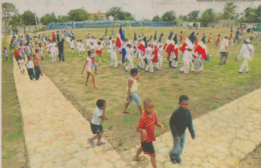
Actividad. Los estudiantes organizaron actos para mostrar su alegría por la apertura del parque.